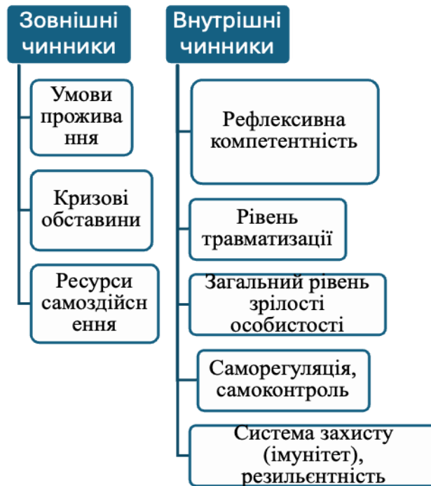
Рис. 1.1. Чинники рівня цілісності / інтегрованості / ідентичності жінок

Система внутрішніх чинників охоплює рівень травматизації, загальний рівень особистісної зрілості, розвинутість механізмів самооцінювання і саморегуляції, систему психологічного захисту, що передбачає сформованість психологічного імунітету і резильєнтності.